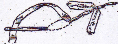
Fig. 3. — Détail de la broderie rococo.

Alors, avec un fil blanc ou de couleur tranchante, on suit à l'aide d'une aiguille enfilée tous les contours du dessin. Puis, avec de fins ciseaux à broder, on taillade le calque de façon à l'enlever facilement. Il ne reste plus qu'à broder en suivant le fil indicateur, que l'on peut même enlever au fur et à mesure que l'on n'a plus besoin de lui.