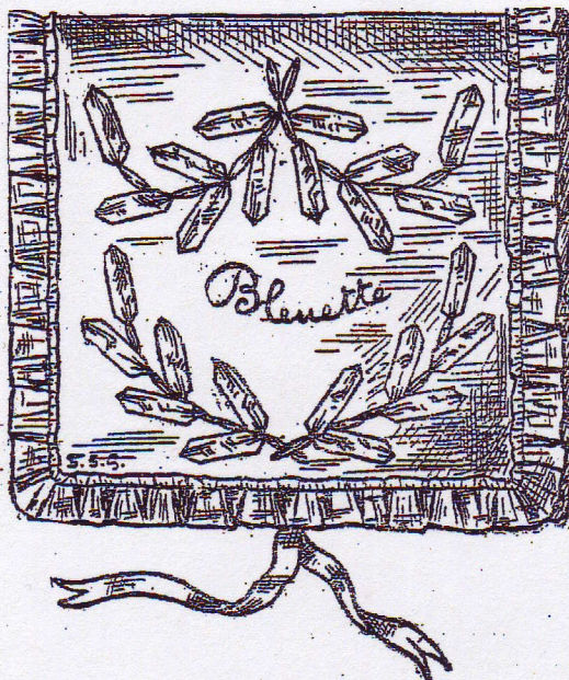
Fig. 2. — Sachet à mouchoirs.