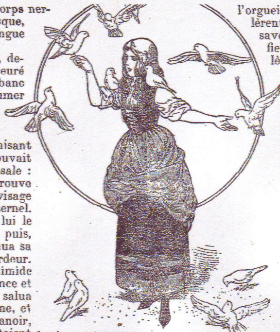
Les beaux oiseaux viennent se poser sur ses doigts.

Elle ne répondit pas, leva sur lui le rayonnement de ses yeux bleus, puis, baissant aussitôt la tête, elle continua sa besogne avec un redoublement d'ardeur. Le jeune comte se sentit presque timide devant cette pauvre fille dont le silence et la réserve révélaient l'humilité. Il la salua comme il aurait salué une noble dame, et s'éloigna vers le grand perron du manoir, où les armes de Bcisgaurant étaient