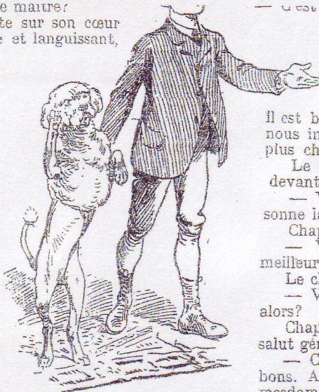
— Je vous présente le seigneur Chap.

Enfin, on se calme et le petit garçon continue :