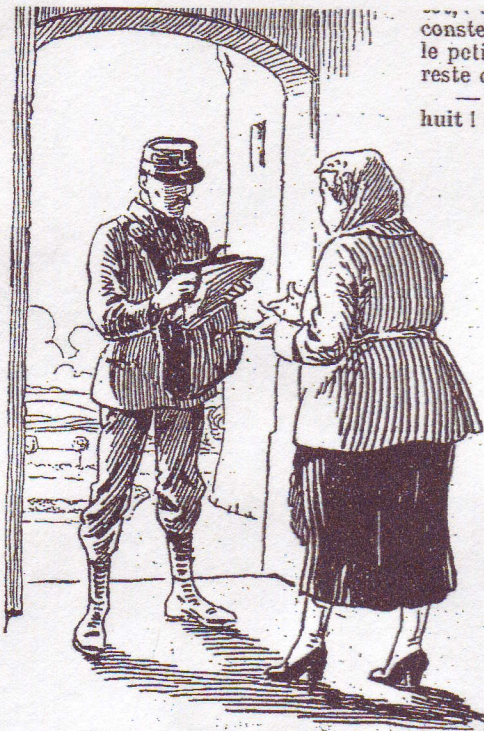
Elle avait déjà reçu deux lettres.

scrutait la physionomie ravagée du baron et, le soir, quand elle eut prié pour tous les siens, elle implora, de tout son cœur aimant, son « petit Jésus si bon » d'arranger les choses afin de consoler ce pauvre Barbe-Bleue.