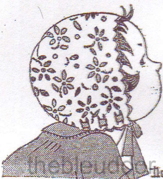
milieu du bonnet à faire en double.