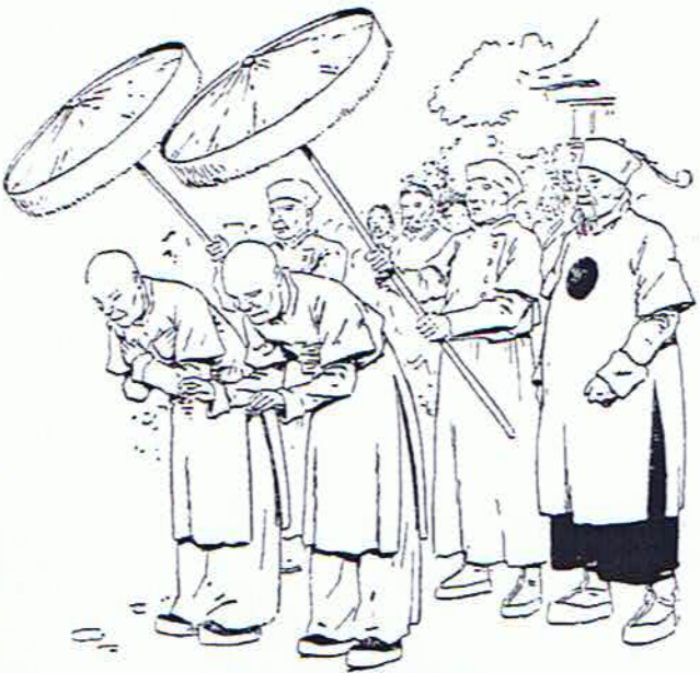
Les lamas s'inclinèrent.

matin, se tenait sur la large jetée qui s'avancait dans le fleuve. Une armée de musiciens frappaient sur de vastes tambours, soufflaient dans des clarinettes, à large pavillon, dans des trompettes immenses. Et les gongs, et les timbales, et les triangles à clochettes, tout cela battait sur un rythme triomphal qu'accompagnait un grand cri sans cesse répété. Ce cri, Germaine et Suzie le reconnurent tout de suite, c'était celui des cimes conquises et des victorieux efforts : — Lha Gyalo ! Lha Gyalo ! Une procession de lamas vêtus de serge grenat, de satin jaune, de brocart d'or, s'avançaient à l'abri de centaines de parasols rouges ou jaunes, tandis que des milliers d'étendards et de bannières aux dessins symboliques semblaient faire, au-dessus de la marée humaine, une seconde foule bruisante et multicolore. Au bord du quai, une escouade d'agents de police armés de bâtons et de martinets maintenait la foule afin de laisser un vaste espace libre sur le débarcadère.