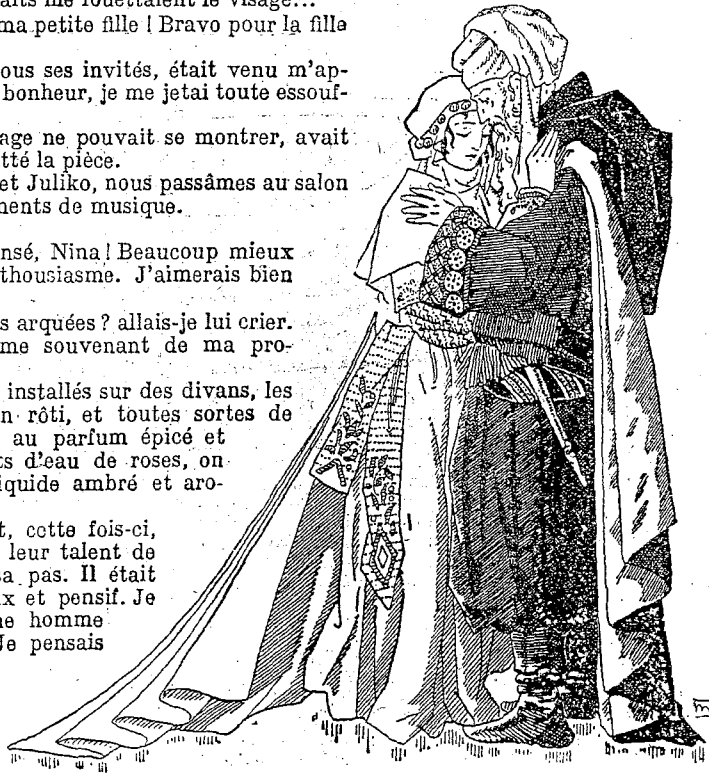
— Qu'Allah bénisse ma petite colombe !